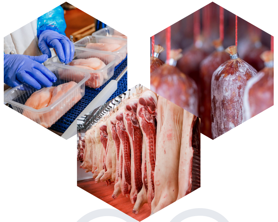
Carni e Salumi